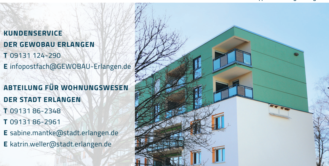
Doppelaufstockung Housing Area