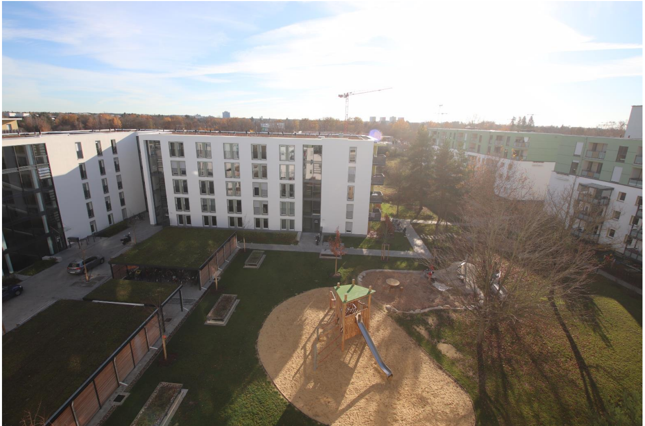
Blick auf den neuen Winkelbau und Aufstockungsgebäude mit Außenraumgestaltung, hier Spielplatz